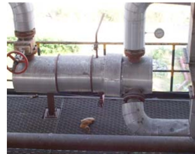
Pemanas Steam – Udara