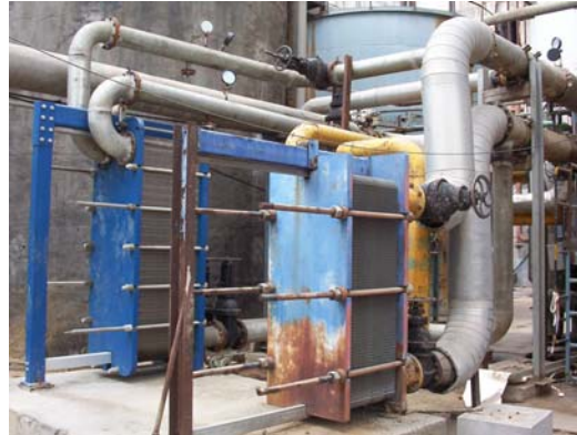
Penambahan Area Transfer Panas

air panas juga dikurangi. Hal ini dapat menurunkan penggunaan steam LP sehingga akan menghemat biaya dan batubara.