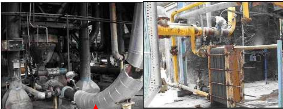
Pipa penghembus flash steam